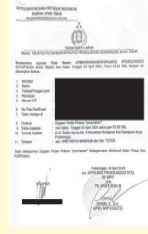
Bukti lapor di Polresta Probolinggo.