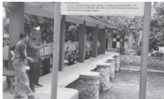
PDAM saat cek Kali Pelayaran.

Sebagai langkah awal, Perumda Delta Tirta Sidoarjo menggelar rapat koordinasi dengan berbagai pihak terkait. Rapat tersebut dilaksanakan pada Senin, 9 September 2024 di Instalasi Pengolahan Air (IPA) Tawangsari.