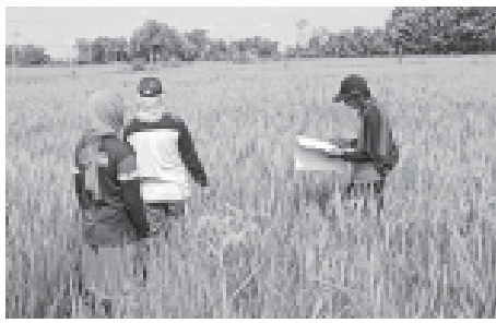
Program PTSL (Pendaftaran Tanah Sistematis Lengkap) di Desa Balungawun, Kecamatan Sukodadi, Kabupaten Lamongan.

LAMONGAN, BN - Kegiatan program Pendaftaran Tanah Sistematis Lengkap (PTSL) tahun 2024 di Desa Balungawun, Kecamatan Sukodadi, Kabupaten Lamongan dipastikan sesuai target.