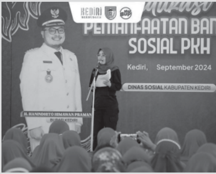
Acara edukasi pemanfaatan bantuan sosial Program Keluarga Harapan (PKH) di Gedung Serbaguna Desa Karangrejo, Kecamatan Ngasem, Jumat (6/9).

Dalam sambutannya, Mbak Dewi menekankan agar bantuan sosial dimanfaatkan secara optimal untuk kebutuhan pokok, bukan untuk hiburan, agar hasilnya maksimal sesuai tujuan program. Ia