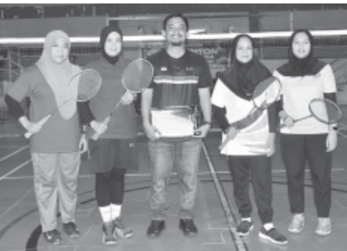
Finalis Bulutangkis Putri antara Diskominfo SP dan Bappelitbangda. (ist)

MANGGAR, BN - Badan Pembina Olahraga Korps Pegawai Negeri RI (Bapor Korpri) Kabupaten Belitang Timur menggelar turnamen antar pegawai di lingkungan Pemkab Beltim. Turnamen ini digelar dalam rangkaian peringatan Hari Olahraga Nasional (Haornas) 9 September 2024 lalu dan HUT Korpri ke-52.