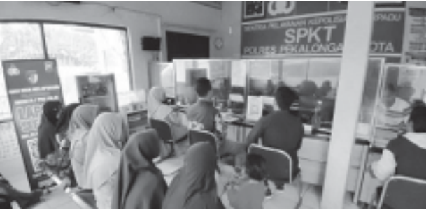
Nasabah Korban BMT Mitra Umat saat konsultasi dengan SPKT Polres Pekalongan Kota.

KOTA PEKALONGAN, BN - Sejumlah nasabah korban BMT Mitra Umat berencana mendatangi Polres Pekalongan Kota. Para nasabah tersebut berniat mendesak polisi untuk secepatnya menuntaskan kasus dugaan penipuan dan penggelapan uang yang dilakukan oleh pengurus BMT Mitra Umat.