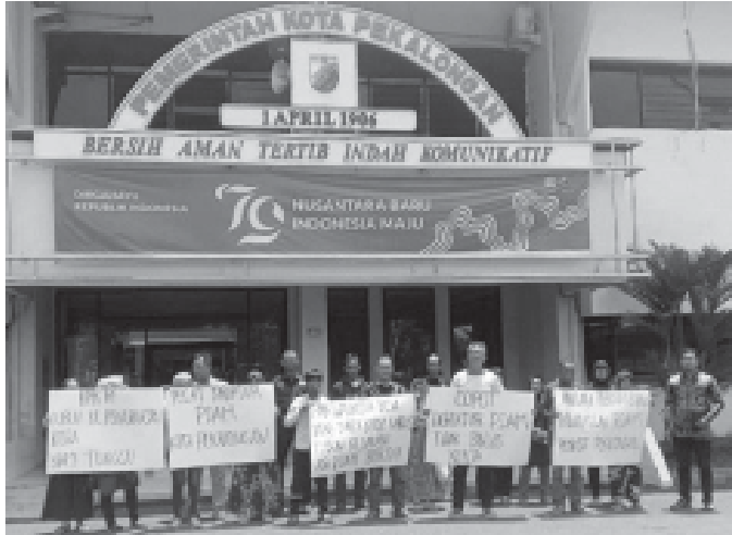
Para pelanggan PDAM Perumda Tirtayasa saat demo di Kantor Pemerintah Kota Pekalongan.

KOTA PEKALONGAN, BN - Belasan pelanggan Perumda Tirtayasa kembali mendatangi Kantor Pemerintah Kota Pekalongan. Kedatangan para pelanggan tersebut bermaksud memprotes kinerja PDAM yang sudah enam bulan dirasakan tidak ada perubahan, bahkan mengancam pemutusan jaringan air.