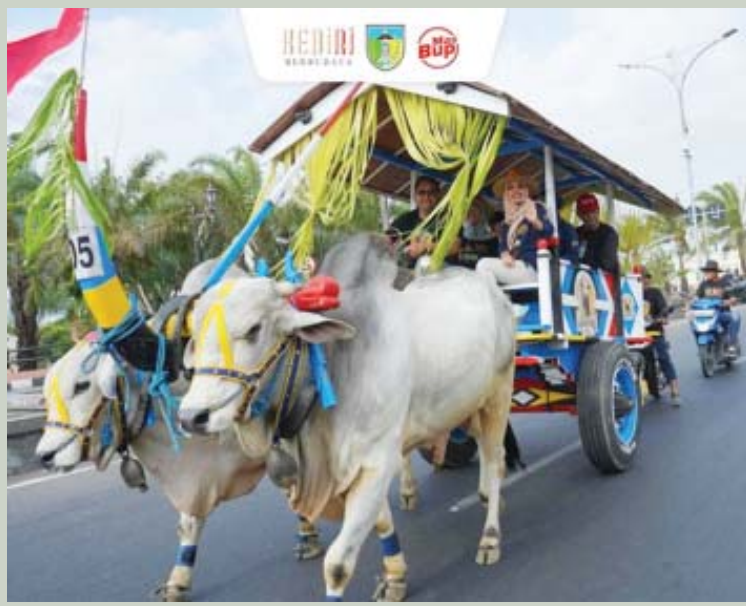
Parade Cikar tahun 2024 yang digelar oleh Dinas Ketahanan Pangan dan Peternakan Kabupaten Kediri.

KEDIRI, BN - Ratusan warga Kabupaten Kediri sangat antusias menyaksikan Parade Cikar tahun 2024 yang digelar oleh Dinas Ketahanan Pangan dan Peternakan Kabupaten Kediri. Mulai garis start Balai Desa Sumberjo hingga Finish Depan Kantor Dinas Perhubungan penonton berjejer rapi sambil mengabadikan dengan telfon genggamnya, Sabtu (7/9).