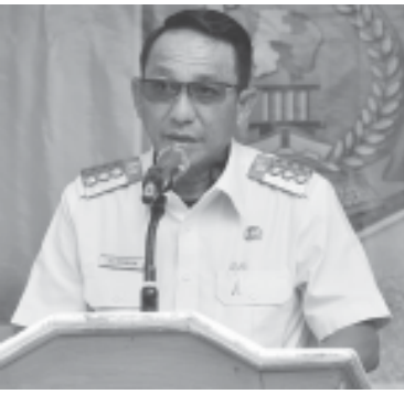
Bupati Beltim Burhanudin. (ist)

MANGGAR, BN - Dinas Pertanian dan Ketahanan Pangan (Distangan) Kabupaten Belitang Timur terus menggalakkan Gerakan Menanam Pangan di Pekarangan (Gempar). Di tahun ke tiga ini sudah banyak manfaat yang dirasakan langsung oleh masyarakat dan pemerintah.