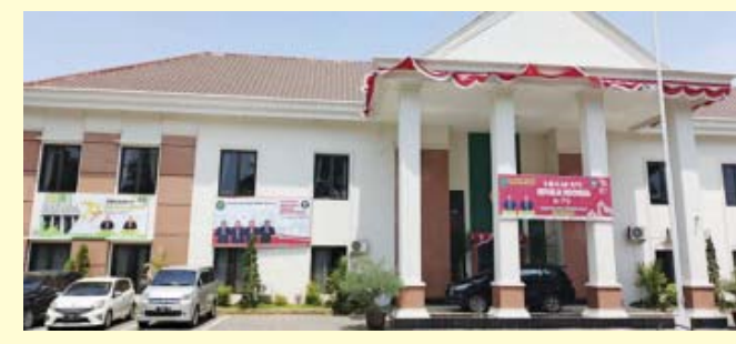
Kantor Pengadilan Agama Kabupaten Pasuruan di Bangil.