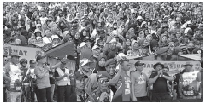
Puluhan Ribu Peserta jalan sehat Penuhi Alun alun Wanareja.

Tato Sebagai Ketua Panitia Jalan Sehat di Alun alun Wanareja ini mengatakan, Acara jalan sehat ini merupakan