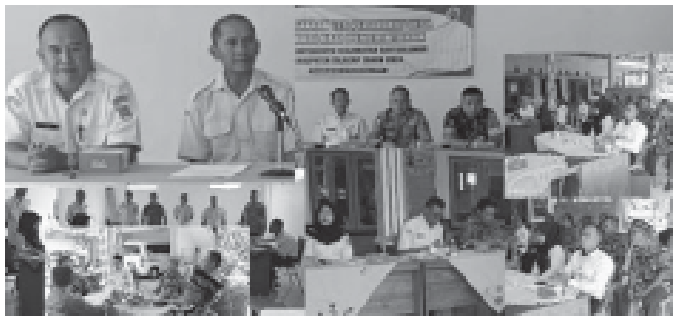
Pelaksanaan Tes Perangkat Desa Formasi Kasi Pemerintahan Desa Sumpinghayu.

CILACAP, BN - Pemerintah Desa Sumpinghayu, Kecamatan Dayeuhluhur, Kabupaten Cilacap melaksanakan ujian penjaringan perangkat desa, Jumat (13/9/2024). Pelaksanaan Tes Perangkat Desa Formasi Kasi Pemerintahan Desa Sumpinghayu yang diikuti Dua Calon, diantaranya: