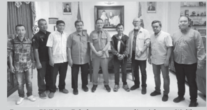
Pengurus PWI Kota Pekalongan, saat audiensi dengan Walikota Pekalongan HA Afzan Arslan Djunaid, SE., MM., di Kantor Walikota Pekalongan, Senin (09/9/2024).

KOTAPEKALONGAN, BN - Menjelang pelaksanaan Konferensi Cabang (Konfercab), Persatuan Wartawan Indonesia (PWI) Kota Pekalongan, menggelar audiensi dengan Walikota Pekalongan HA Afzan Arslan Djunaid, SE., MM. di Kantor Walikota Pekalongan, Senin (09/9/2024). Audiensi yang diikuti jajaran Pengurus PWI Kota Pekalongan itu membahas terkait rencana pelaksanaan Konfercab PWI Kota Pekalongan.