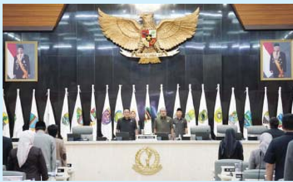
Suasana Rapat Paripurna DPRD Jabar dengan agenda pengumuman Pembentukan Fraksi-Fraksi Masa Jabatan 2024-2029.