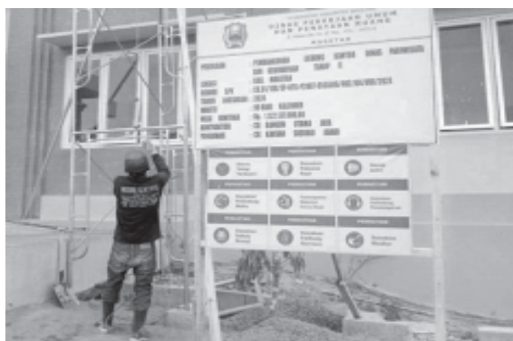
Pembangunan Kantor Dinas Pariwisata dan Kebudayaan (Disparbud) Kabupaten Magetan Tahun 2024 tahap kedua. (Ashar)

Informasi diterima bidiknasional.com bahwa gedung