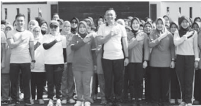
Ketua Pj. TP PKK Kab Bogor Olahraga Bersama, Dalam Rangka memperingati HKGB ke 72 Tahun.