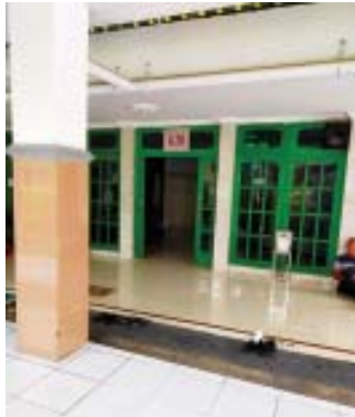
Masjid RSUD Jombang yang gagal direhab.