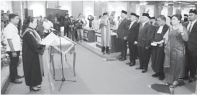
Pengucapan Sumpah Janji Anggota DPRD Asahan Periode 2024 - 2029