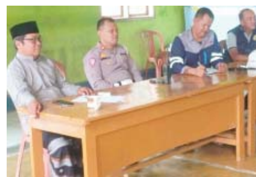
Dari kiri ke kanan: Kepala Desa Rancahilir, Kanit Lantas Polsek Pamanukan, Daja pihak PT HK, dan Kanit Intel Polsek Pamanukan. (M.Tohir)

Subang, BN - Adanya pekerjaan Proyek Jalan Tol Akses ke Pelabuhan Patimban di Kabupaten Subang, Provinsi Jawa Barat yang menghubungkan Jalan Pantura dengan Jalan Tol Cikopo - Palimanan (Cipali) km 89+000 yang menuju ke pelabuhan Patimban menjadi keresahan warga desa rancahilir Kec. Pamanukan, Kab. Subang Jawa barat.