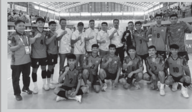
Pj Bupati Pinrang, H. Ahmadi Akil, saat memberikan semangat kepada para atlet asal Kabupaten Pinrang yang berlaga di ajang PON XXI Aceh-Sumatera Utara.

gemilang dan mengharumkan nama Pinrang di ajang olahraga nasional empat tahunan tersebut.