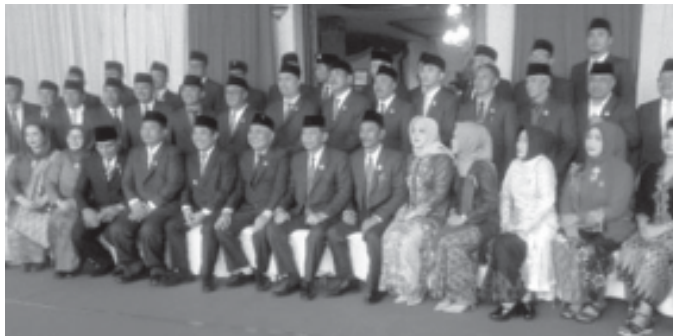
Rapat Paripurna Pengambilan Sumpah Janji 45 Anggota DPRD Kab Madiun Terpilih Masa Keanggotaan 2024 - 2029.

MADIUN, BN – Dewan Perwakilan Rakyat Daerah (DPRD) Kabupaten Madiun, menggelar rapat paripurna dalam rangka pengambilan sumpah dan janji 45 anggota DPRD Kab Madiun terpilih masa keanggotaan 2024 - 2029 pada hari Sabtu (24/08/2024) bertempat di ruang paripurna DPRD Madiun.