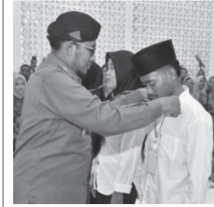
Bupati Sumenep H. Achmad Fauzi Wongsojudo, SH. (Yu)

SUMENEP, BN - Dalam rangka untuk mengurangi pengangguran di Kabupaten Sumenep, Pemerintah mengajak kepada pemuda-pemudi di Diklat keterampilan yang dibutuhkan sesuai dengan perkembangan zaman modernisasi.