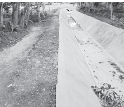
Perbaikan saluran irigasi di Desa Kertahayu Kecamatan Pamarian Kabupaten Ciamis (Asep Sujana)

BANJAR, BN – Perbaikan saluran irigasi di desa Kertahayu kecamatan Pamarian, Ciamis, Jawa Barat berjalan lancar. Masyarakat Dusun Cilisung menyambut antusias pembangunan tersebut.