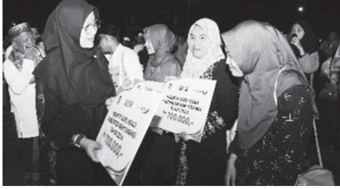
Bupati Ipuk Fiestiandani pada acara Peringatan Maulid Nabi di Pantai Marina Boom, Banyuwangi, Sabtu malam (14/9/2024). Acara dihadiri ribuan guru ngaji.

BANYUWANGI, BN – Sebanyak 14.119 orang guru ngaji menerima insentif dari Pemkab Banyuwangi. Pada tahun 2024 ini dialokasikan anggaran sekitar Rp9,88 miliar untuk insentif guru ngaji dan ini sudah berlangsung sejak 2011.