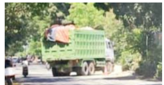
Kendaraan dump truk tronton yang keluar masuk ke lokasi revitalisasi lapangan Gajah Mada di Jalan Sumargo Kecamatan/Kabupaten Lamongan.

Hal senada dikatakan Anto. Dirinya mengaku tak nyaman dengan keberadaan