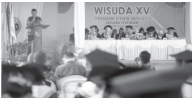
Pada Wisuda XV STIPER Belitang ini Bupati OKU Timur Ir. H. Lanosin, M.T. hadir langsung mengikuti prosesi momen sakral tersebut. Sabtu, 21 September 2024.

OKU TIMUR, BN - Dalam sambutannya, Bupati Enos mengucapkan selamat kepada wisudawan/i. Ia menekankan seorang sarjana harus mampu menganalisa sesuatu yang sedang akan terjadi.