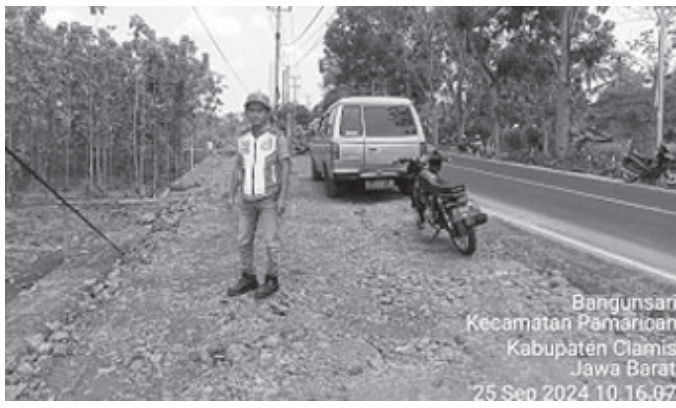
Proyek Jalan Ciamis Pangandaran sedang dikerjakan.

BANJAR, BN - Pekerjaan jalan Nasional wilayah III Propinsi Jawa Barat preservasi jalan yang menghubungkan Ciamis dan Pangandaran berjalan lancar. PT Modern Widya Tehnical sebagai pelaksana proyek