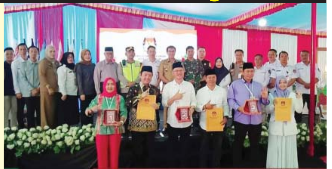
Rapat pleno terbuka yang digelar KPUD Kota Pagar Alam agenda pengundian dan penetapan nomor urut Pasangan Calon Walikota dan Wakil Walikota Pagar Alam untuk Pilkada Kota Pagar Alam tahun 2024. (leo)

"Nomor urut itu juga nantinya yang akan ada dikertas suara, untuk itu masyarakat dapat mengingat nomor urut masing-masing pasangan calon agar nanti bisa menentukan pilihan pada tanggal 27 November 2024 mendatang," ujarnya. (Leo/adv)