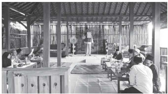
Tim 7 saat rapat bersama di Rumah Makan (RM) Suka Jaya Spesial Kambing Muda.

Dukungan dari para kyai NU yang ada di wilayah dua Kecamatan tersebut berangkat dari hati nurani para kyai itu sendiri yang ingin menyalurkan hak pilihnya untuk kemenangan dari kelu-