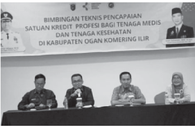
Kegiatan Sosialisasi dan Bimbingan Teknis Pembelajaran di Plataran Sehat untuk Tenaga Medis dan Kesehatan di Kabupaten OKI

Kegiatan sosialisasi ini dilakukan selama bulan September kepada tenaga apoteker dokter dan dokter gigi pada