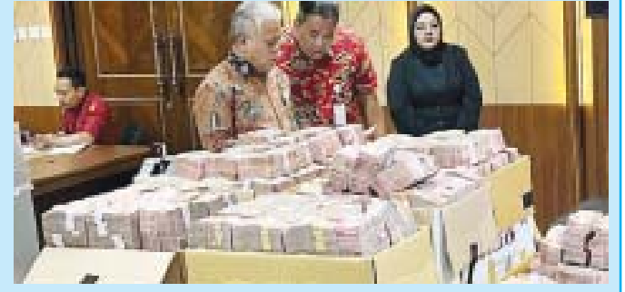
Barang bukti uang korupsi yang disita Kejagung.