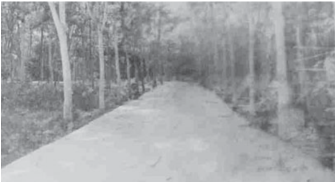
Proyek dana desa Tanjung Kemala.