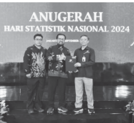
ANUGERAH HARI STATISTIK NASIONAL 2024

JAKARTA, BN - Kabupaten Belitang Timur (Beltim) berhasil meraih nilai kategori BAIK untuk nilai Indeks Pembangunan Statistik (IPS) Tahun 2024 pada Penghargaan Anindhita Wistara Data (AWD) 2024.