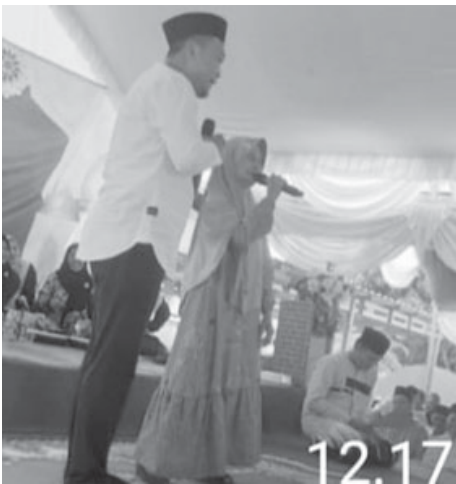
Peringatan Maulid Nabi Muhammad SAW, Desa Suka Mukti, Kecamatan Mesuji.

OKI, BN - Dalam rangka memperingati Maulid Nabi Muhammad SAW, masyarakat Desa Suka Mukti, Kecamatan Mesuji, Kabupaten Ogan Komering Ilir menggelar acara pengajian yang berlangsung khidmat Minggu (21/9). Acara ini dihadiri oleh tokoh agama, pejabat pemerintah, serta ratusan jamaah dari berbagai wilayah sekitar.