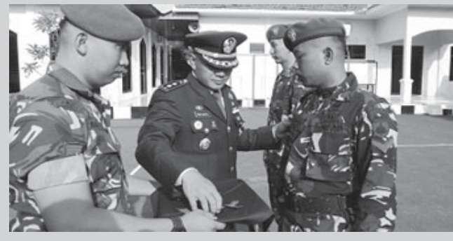
Para Personel Kodim 0710/Pekalongan saat Naik Pangkat.

KOTA PEKALONGAN, BN - Bertepatan dengan peringatan Hari Kesaktian Pancasila pada 1 Oktober 2024, sebanyak 63 personel Kodim 0710/Pekalongan menerima kenaikan pangkat setingkat lebih tinggi. Mereka yang menerima kenaikan pangkat terdiri dari 7 personel tamtama dan 56