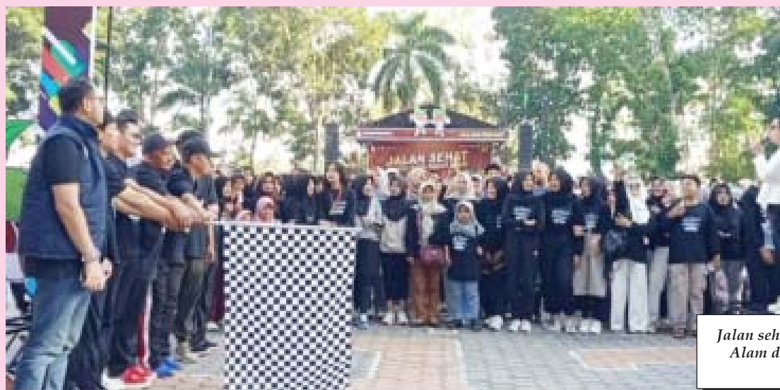
Jalan sehat yang digelar KPUD Kota Pagar Alam dalam rangka sosialisasi Pilkada Damai.

PAGAR ALAM, BN - Pilkada damai tahun 2024 Daerah (KPUD) Kota Pagar Alam melibatkan masyarakat dari pemuda