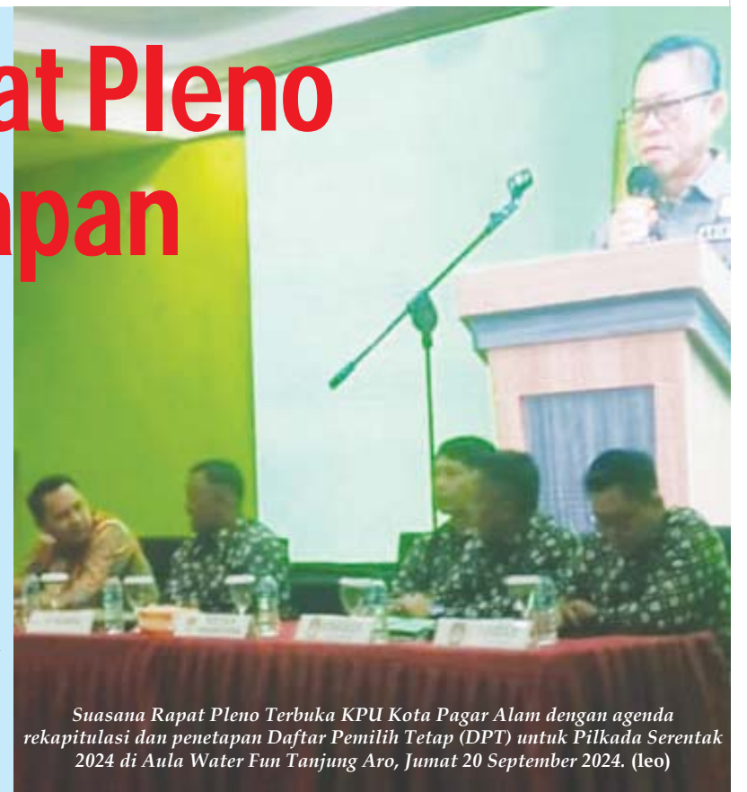
Suasana Rapat Pleno Terbuka KPU Kota Pagar Alam dengan agenda rekapitulasi dan penetapan Daftar Pemilih Tetap (DPT) untuk Pilkada Serentak 2024 di Aula Water Fun Tanjung Aro, Jumat 20 September 2024. (leo)

Dengan penetapan DPT ini, KPU Kota Pagaralam mengharapkan tahapan selanjutnya dapat berjalan lancar dan partisipasi masyarakat dalam Pilkada dapat meningkat. (Leo)