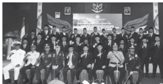
Acara pelantikan 25 Anggota DPRD Beltim.

Acara pelantikan dimulai dengan Pembacaan Surat Keputusan (SK) Penjabat Gubernur Kepulauan Bangka-Belitung, Sugito yang dibacakan oleh Sekretaris DPRD Beltim, Fitri Zakiah. SK berisi tentang Pemberhentian anggota DPRD Kabupaten Beltim periode 2019-2024 dan pengangkatan anggota DPRD Kabupaten Beltim periode 2024-2029.