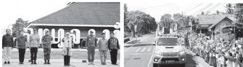
Kirab Pataka Jer Basuki Mawa Beya dalam rangka memperingati HUT Ke-79 Provinsi Jawa Timur tiba di Kabupaten Lumajang. (son)

"Pancasila, UUD 1945, Bhineka Tunggal Ika, dan NKRI adalah harga mati yang harus dijaga dan dilindungi oleh segenap jiwa dan raga. Sinergitas dan kolaborasi adalah kunci keberhasilan pembangunan menuju kemajuan dan kesejahteraan masyarakat. Optimis Jatim bangkit, Jawa Timur maju, Indonesia maju. Dirgahayu Provinsi Jawa Timur," ungkapny. (son)