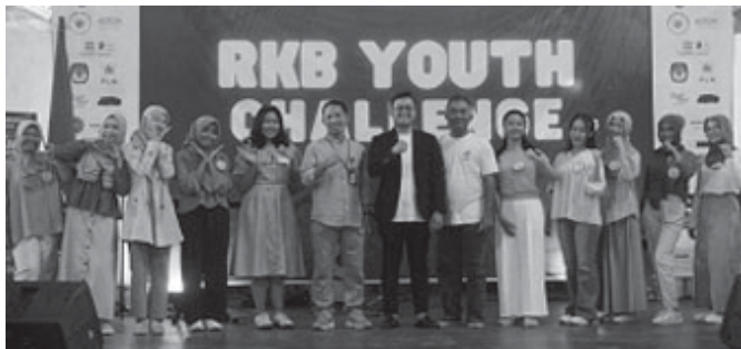
Sosialisasi Tahapan Pilkada 2024 yang digelar KPU Kota Pekalongan.

KOTA PEKALONGAN, BN - Menjelang Pemilihan Kepala Daerah (Pilkada) tahun 2024, KPU Kota Pekalongan mengajak para pemilih pemula untuk turut memberikan hak pilihnya pada bulan November mendatang dan lebih fokus serta peduli dengan isu demokrasi yang ada. Hal ini disampaikan oleh Kadiv