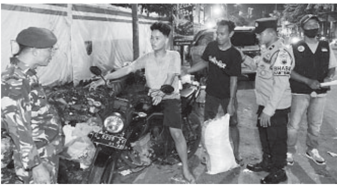
Petugas DLH saat lakukan pengawasan oknum Pembuang Sampah Sembarangan di Jalan Protokol.

"Ada beberapa ruas jalan protokol yang sudah biasa dimanfaatkan pedagang pasar serta warga sekitar untuk membuang sampah secara liar. Padahal, hal ini jelas melanggar dan tidak diperbolehkan. Pengawasan berkala pada malam hari ini dilakukan selama 3 (tiga) hari, 27