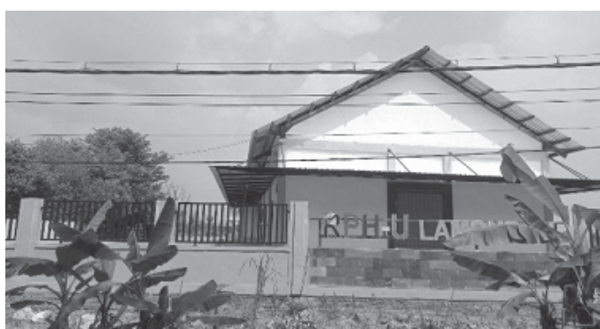
Lokasi gedung Rumah Potong Hewan Unggas (RPH-U) yang ada di kompleks Pasar Sidoharjo, Lamongan, Jawa Timur.

(ruangan yang digunakan untuk menyimpan semua produk beku) Kepala Dinas Peternakan dan Kesehatan Hewan (Disnakeswan) diduga melakukan pembongkaran bagian ruang RPH-U yang masih berfungsi, padahal perkara dugaan korupsi RPH-U saat itu mulai dan sedang ditangani oleh Kejari Lamongan.