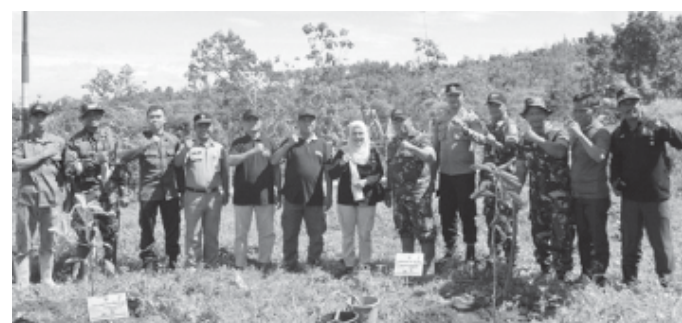
Peringatan Hari Aksi Tanam Pohon yang digelar DLH Jombang.

JOMBANG, BN - Hari Menanam Pohon Indonesia (HMPI) diperingati setiap tanggal 28 November. Peringatan ini bertujuan untuk meningkatkan kesadaran dan kepedulian masyarakat tentang pentingnya menanam pohon untuk memulihkan kerusakan Sumber daya hutan dan lahan. Untuk itu Dinas Lingkungan Hidup (DLH) Jombang selalu memperingatinya. Dalam Aksi Tanam Pohon Untuk Mengkampanyekan Jombang Sedekah Oksigen