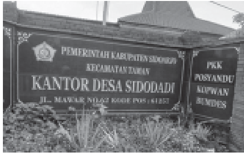
Kantor Desa Sidodadi Kecamatan Taman Kabupaten Sidoarjo. (yah)

SIDOARJO, BN - Program PTSL (Pendaftaran Tanah Sistematis Lengkap) pada tahun 2023 sekitar bulan 8 di desa Sidodadi Kecamatan Taman Kabupaten Sidoarjo diduga timbul masalah. Nara sumber berinisial (R) menceritakan, ada warga yang viral di video beredar di warga desa Sidodadi.