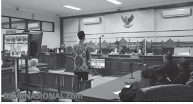
Suasana persidangan di Pengadilan Tipikor Surabaya.