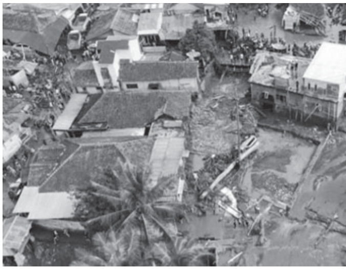
Rumah warga terdampak banjir bandang di Kampung Cisayar, Desa Mekarsari, Kecamatan Nyalindung, Kabupaten Sukabumi (4/12/2024).

DEPOK, BN - PT Tirta Asasta Kota Depok (Perseroda) kembali menunjukkan komitmen sosialnya melalui aksi nyata membantu korban banjir bandang yang melanda Kampung Cisayar, Desa Mekarsari, Kecamatan Nyalindung, Kabupaten Sukabumi. Bersama Pemerintah Kota (Pemkot) Depok, perusahaan ini menyalurkan bantuan kemanusiaan kepada warga terdampak bencana yang terjadi pada 4 Desember 2024.