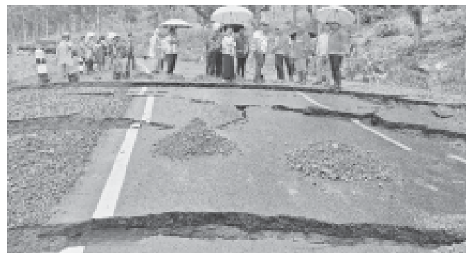
Jalur Lintas Selatan (JLS), Dusun Panggungwaru, Desa Sumberoto Kec. Donomulyo, Kabupaten Malang yang ambles.

Dalam peninjauan ini, rombongan mendapati sejumlah