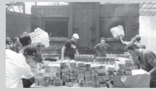
Petugas Bea Cukai ketika memusnahkan rokok ilegal di PT Hijau Alam Nusantara, Mojokerto.

□ Kerugian Negara Diperkirakan Rp 501.542.200