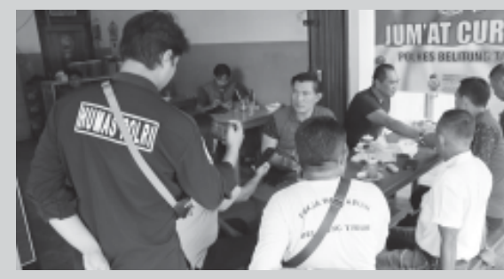
Giat Jumat Curhat di Warkop Kongfu, Manggar.

MANGGAR, BN - Dalam rangka persiapan menyambut perayaan Natal 2024 dan Tahun Baru 2025 (Nataru), Polres Belitung Timur (Beltim) dan jajarannya melakukan langkah strategis untuk menjaga keamanan, ketertiban dan kenyamanan masyarakat di wilayah hukum Kabupaten Beltim.