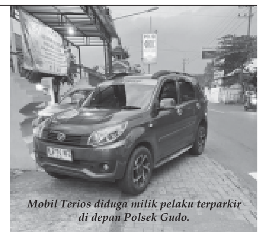
Mobil Terios diduga milik pelaku terparkir di depan Polsek Gudo.

"Kami masih mengumpulkan Bukti bukti termasuk dengan CCTV jika diperlukan Pihak Laka Polres Jombang terkait Kecelakaan tersebut, bahkan saat kejadian dari pihak anggota kita sempat mengantarkan Korban ke RSUD Jombang meskipun dalam perjalanan meninggal dunia. Mengenai Keberadaan mobil terios tersebut saya mohon waktunya untuk konsolidasi dengan anggota saya terkait bagaimana yang sebenarnya kecelakaan tersebut, kita melepas mobil Terios itu karena kami belum tahu kronologi kejadian itu yang sebenarnya, kami masih menunggu hasilnya dalam penanganan, bahwa proses saat ini sudah ditangani Unit Laka Polres Jombang," ujarnya. Sementara saat ini bn.com masih melakukan penelusuran lebih lanjut siapa AN tersebut yang di duga pelaku tabrak lari. (Tok)