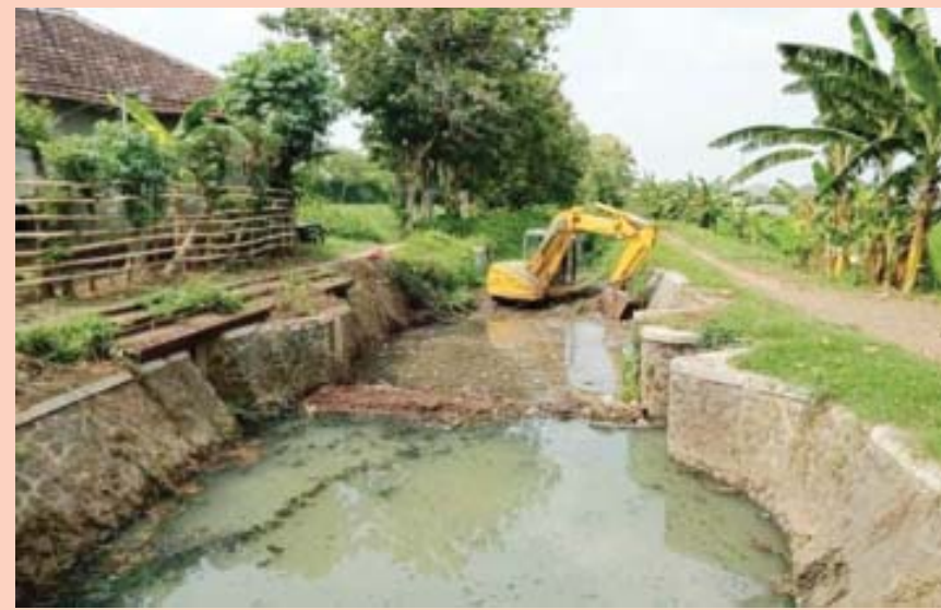
Alat berat dikerahkan untuk membersihkan Sungai Tambora.

membersihkan sungai berwarna hitam tersebut. Normalisasi ini dikerjakan pada bulan Oktober tahun 2024 dengan panjang sungai kurang lebih dari 365 meter. "Kami dari dinas PU (dinas PUPR, Red)," ucap pekerja itu sambil menyusuri sungai.