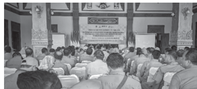
Ratusan Kepala Desa di Kabupaten Madiun saat acara penandatanganan pakta integritas dan terima SK hasil evaluasi Raperdes APBDDesa 2025 di Pendopo Ronggo Djoemeno Caruban, acara tersebut digelar, Senin (09/12/2024).

MADIUN, BN - Dalam rangka hari anti korupsi sedunia (Hakordia) 2024, Pemerintah Kabupaten Madiun melalui Dinas pemberdayaan masyarakat dan desa hadirkan ratusan Kepala Desa. Kegiatan ini dalam rangka penyampaian keputusan bupati tentang hasil evaluasi rancangan peraturan desa tahun anggaran 2025 sekaligus penandatanganan pakta integritas. Bertempat di Pendopo Ronggo Djoemeno Caruban, acara tersebut digelar, Senin (09/12/2024).