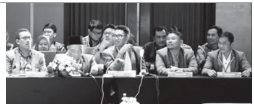
Semua saksi dari masing-masing Paslon telah menerima hasil rekapitulasi penghitungan suara tingkat kabupaten yang dilakukan KPU Sidoarjo untuk pemilihan Gubernur-Wakil Gubernur maupun Bupati-Wakil Bupati Sidoarjo. (yah)

Berdasarkan hasil rekapitulasi tingkat kabupaten yang dilakukan KPU Sidoarjo menyebutkan untuk pemilihan Bupati-Wakil Bupati Sidoarjo yang dinyatakan sah sebanyak 963.877 surat suara,