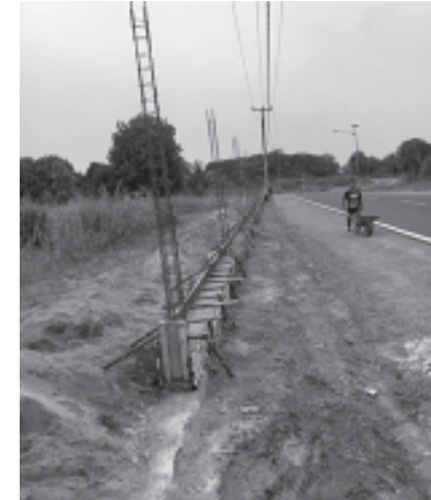
Bangunan pagar jalan Beringin desa Berakit, Kec Teluk Seborg.

BINTAN, BN - Atas pembangunan pagar halaman rumah yang terletak di daerah kampung desa Berakit, Kec Teluk Seborg jalan beringin dengan panjang 150 meter dan tinggi pagar 2,5 meter diduga tanpa ada Ijin Mendirikan Bangunan (IMB).