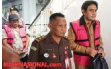
Tersangka Ketika digiring ke tahanan oleh staf Kejari Sidoarjo.

Keempat tersangka yang ditahan berinisial IF, BS, R, dan S. Mereka kini telah ditahan di tahanan. ■ Bersambung ke hal.11 kol.1