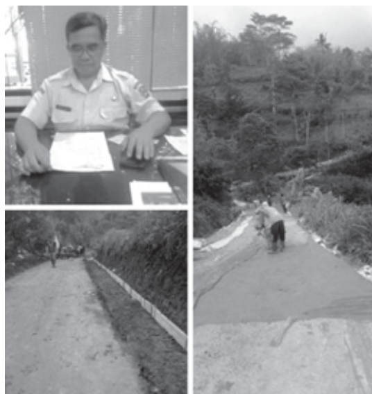
Haryanto Kabid Binamarga Dinas PUPR Magetan dan jalan terjal di desa Plumpung yang ditingkatkan. (ashar)

MAGETAN, BN - Di akhir Tahun 2024 Bidang Binamarga Dinas PUPR Magetan mulai melaksanakan beberapa perbaikan jalan atau pun peningkatan jalan dan salah satu nya di Desa Plumpung Kecamatan Plaosan berupa aspal beton/rijik di jalan poros antar desa di Kecamatan Plaosan.