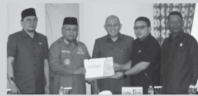
Anggota DPRD Kabupaten Belitang Timur saat reses di Kantor Desa Mentawak Kecamatan Kelapa Kampit, Senin (2/12/24).

MANGGAR, BN – Seluruh anggota DPRD Kabupaten Belitang Timur telah menyelesaikan pelaksanaan Reses Masa Persidangan I 2024-2025. Kegiatan reses berlangsung mulai 1 Desember 2024 lalu di masing-masing Daerah Pemilihan.