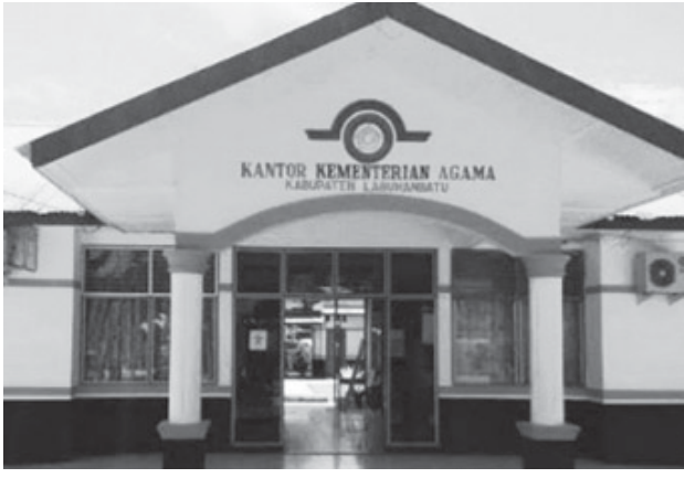
Kantor Kemenag Labuhanbatu. (Sukmo)

Asbin menyampaikan terkait laporan Kepsek MAN Munir Nasution ke Kemenag Labuhanbatu sudah kita tindak lanjuti dengan mengeluarkan surat tugas Nota dinas sejak tanggal 25 November tahun 2024 terhadap kedua