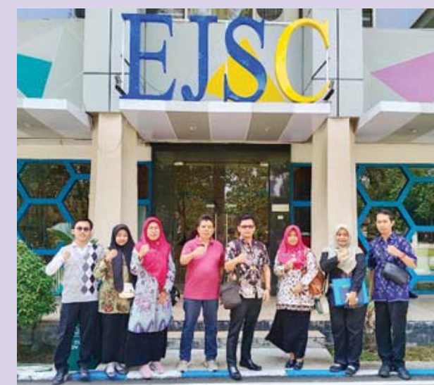
Program PPP Bulu bekerjasama dengan East Java Super Corridor (EJSC) Jawa Timur Luncurkan Program Circle Hub SIPARIMANTA 2.0. (dkp)

TUBAN, BN - Unit Pelaksana Teknis Pelabuhan Perikanan Pantai Bulu menyelenggarakan fungsi melaksanakan sebagian tugas teknis dinas di bidang pelayanan teknis pelabuhan perikanan pantai, tata kelola dan pelayanan usaha, ketatausahaan dan pelayanan masyarakat. Guna mempercepat transformasi digital serta mewujudkan budaya kerja PROAKTIF (Profesional, Akuntabel, Transparan, Integritas dan Inovatif) Unit Pelaksana Teknis (UPT) Pelabuhan Perikanan Pantai Bulu - Tuban meluncurkan berbagai inovasi berbasis digital. Salah satunya adalah SIPARIMANTA (Sistem Informasi Permohonan Magang dan Permintaan Data).