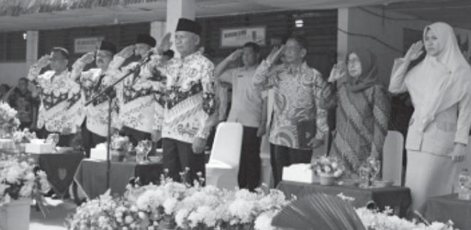
Bupati Asahan H Surya BSc saat peringatan hari guru.

ASAHAN, BN - Bupati Asahan H Surya BSc mengapresiasi serta menghormati jasa para guru yang telah mengabdikan diri untuk mendidik generasi penerus bangsa. Ini disampaikan Bupati Asahan saat memimpin upacara Hari Ulang Tahun (HUT) ke-60 Persatuan Guru Republik Indonesia (PGRI) dan Hari Guru Nasional Tahun 2024 di UPTD SMP Negeri 1 Simpang Empat, Kamis (05/12/2024). Bupati Asahan juga mengatakan, guru adalah kunci utama dalam transformasi pendidikan. Gurulah yang memegang peranan penting dalam mengembangkan potensi peserta didik, sehingga mereka dapat menjadi generasi yang unggul dan berdaya saing untuk mencapai Indonesia emas seperti apa yang dicita-citakan.