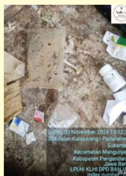
Limbah medis ditemukan dibuang sembarangan.