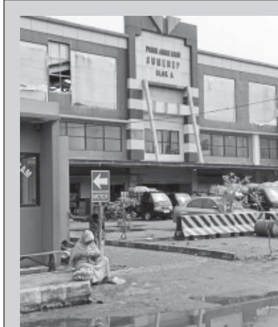
Pasar Anom Sumenep

SUMENEPE, BN- Sejak dibangun pasar anom baru di desa Kolor, stand lokasi tingkat tidak ditempati para pedagang. Bahkan perluasan pembanguna pedagang kecil penjual sayur mayur disamping selataan pasar anom yang dibangun untuk penjual.