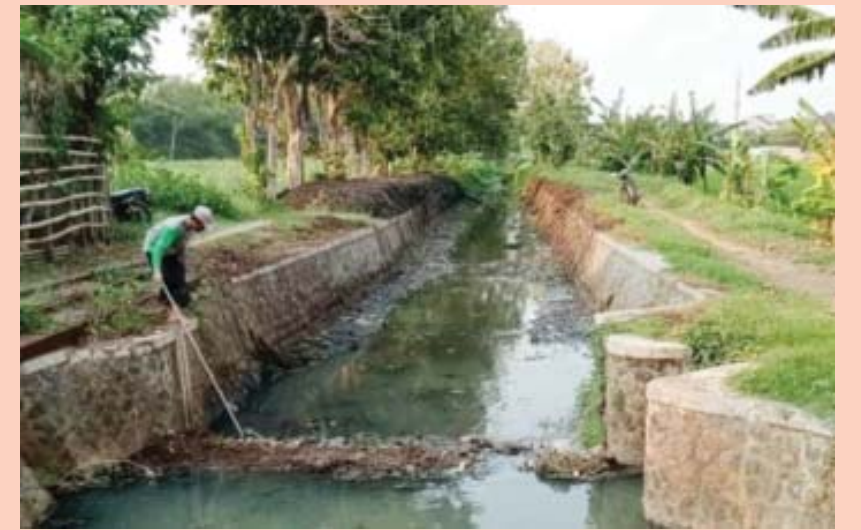
Pekerja Dinas PUPR Kota Kediri saat normalisasi Sungai Tambora Kelurahan Mojo.

Sebab, semak belukar di sungai itu sudah terlalu penuh. Pembersihan sungai seperti ini akan dilakukan secara rutin untuk mencegah banjir. (AdvPUPRKotaKdr/ND)