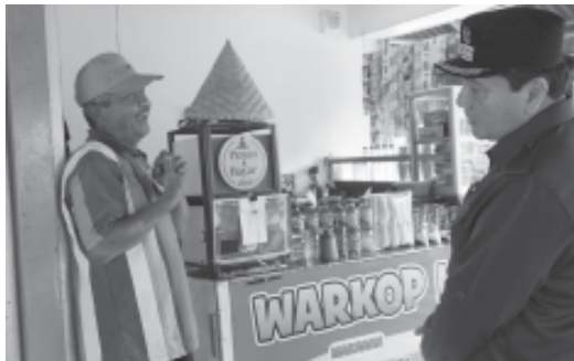
Pj. Bupati Bogor Bachril Bakri saat kunjungan ke wilayah Kecamatan Cisarua mengecek sejumlah lokasi yakni Warpat, Riang Gunung dan Rest Area. (eml)

BOGOR, BN - Pastikan pasca penertiban sejumlah Pedagang Kaki Lima (PKL) yang ada di Warpat dan jalur kawasan wisata Puncak, yang berjalan dengan baik, Pj. Bupati Bogor Bachril Bakri lakukan kunjungan ke wilayah Kecamatan Cisarua untuk mengecek sejumlah lokasi yakni Warpat, Riang Gunung dan Rest Area, Minggu (8/12/2024).