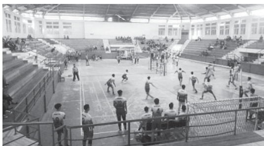
Turnamen Bola Volly antar Pelajar Tingkat SMKS di Gedung Olahraga Tajdmalela

SUMEDANG, BN - Dari 14 Kabupaten yang mengikuti Pertandingan Bola Volly antar Pelajar Tingkat Sekolah Menengah Kejuruan Atas Swasta (SMKS) diantaranya masuk pada putaran semifinal putra harus melawan Putra Pelajar SMKS antara Garut dan Tasikmalaya dimenangkan Oleh Tasikmalaya, Subang melawan Bekasi dimenangkan oleh Bekasi.