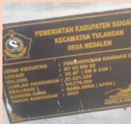
Prasasti tertulis kandang dibangun Dana Desa (APBN) tahun 2023, bukan dana hibah.

Rp 154 juta, sebanyak Rp 54 juta untuk membangun kandang sapi, Rp 50 juta untuk beli tiga ekor sapi dan sisanya Rp 50 juta untuk rapat.