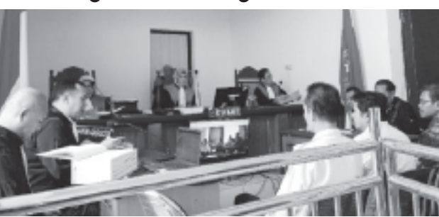
Tiga saksi dihadirkan dalam persidangan dugaan korupsi pembangunan SDN 2 Sumurgede.

GROBOGAN, BN - Sidang lanjutan dugaan Korupsi Pembangunan SDN 2 Sumurgede, Kecamatan Godong, Kabupaten Grobogan digelar di Pengadilan Tipikor Semarang atas nama terdakwa DP, Rabu (11/12/2024).