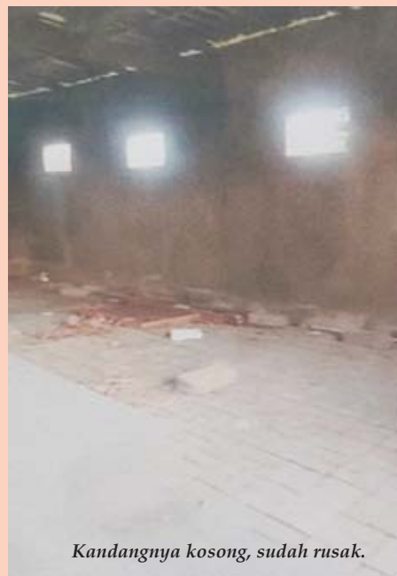
Kandangnya kosong, sudah rusak.