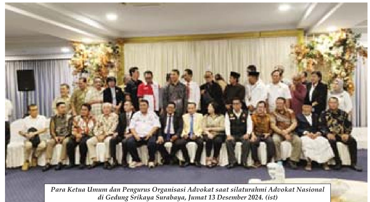
Para Ketua Umum dan Pengurus Organisasi Advokat saat silaturahmi Advokat Nasional di Gedung Srikaya Surabaya, Jumat 13 Desember 2024. (ist)

SURABAYA, BN - Assalamu'alaikum, Salam sehat, Sehubungan dengan adanya pertemuan Ketua Umum dan Pengurus Organisasi Advokat dengan Agenda Silaturahmi Advokat Nasional pada Tanggal 13 Desember 2024, bertempat di